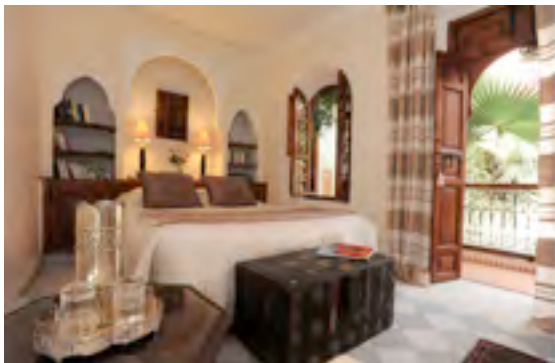
Das Beduinen-Zimmer des Sable Chaud