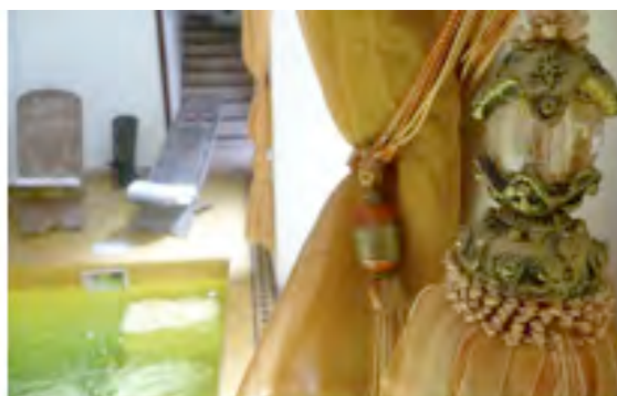
Entspannung für Körper und Geist

Vom Riad Sable Chaud kann man jeden Tag aufs Neue auf Entdeckungsreise gehen und das Labyrinth aus Märkten und bunten Ständen erkunden: Das riesige Angebot an Kräutern, Gewürzen und Früchten, aber auch die unglaubliche Vielfalt an Textilien, Teppichen, Lederwaren, Schmuck, Keramik im Zentrum der ehemaligen Hauptstadt Marokkos übersteigt die Erwartungen und die Vorstellungskraft der Besucher.