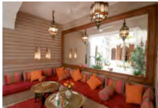
Die komfortable Sitzecke im Innenhof

Ein weiteres Angebot des Riad Sable Chaud: Man kann sich jeden Morgen aufs Neue sein eigenes frisches Brot backen lassen. Gleich in der Nähe des Sable Chaud steht der historische Stadt-Holzofen, in dem man hautnah miterlebt, wie einem sein Lieblingsbrot zubereitet wird. Ein weiterer Höhepunkt in der Umgebung des Riad Sable Chaud ist das Minarett der Koutoubia-Moschee, das mit seinen 69 Metern die Stadt überragt. Bereits im 12. Jahrhundert erbaut, ist diese Moschee die größte von Marrakesch und eine architektonische Inspiration für Freunde der Baukunst. Ebenfalls nur einen kurzen Fußmarsch vom Riad Sable Chaud entfernt liegt der El Badi Palast, ehemals ein riesiger Palast mit 360 Zimmern, einem immensen Garten und fein gearbeiteten Interieurs. Heutzutage erinnern allerdings nur noch Überreste an seine glorreiche Vergangenheit. Die Souks, die man hauptsächlich im nördlichen Teil der Medina findet, runden das Bild von Marrakesch ab und sind absolut sehenswert. Zu empfehlen ist außerdem ein Besuch des modernen Viertels Gueliz. Hier zeigt sich ein ganz anderer, sehr kosmopolitischer Flair von Marrakesch, denn mit seinen schicken Restaurants und großen Einkaufsstraßen ist Gueliz eine neue Facette. Marrakesch bietet seinen Besuchern insgesamt eine riesige kulturelle Vielfalt.