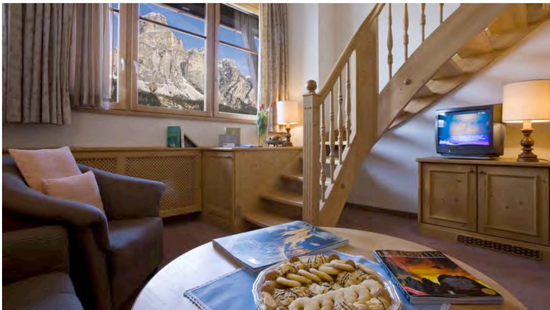
Die Mansardensuite des Posta Zirm Hotels

Das Posta Zirm Hotel besteht aus dem altherwürdigen Haupthaus und einem geschmackvollen Neubau, der mit dem Haupthaus intern verbunden ist. Hier liegen unter anderem auch die Doppelzimmer de luxe, die ein hohes Niveau an Komfort und einen privaten Balkon mit einer grandiosen Sicht zum Berg "Boe" und zur Kirche von Santa Caterina bieten. Ein absolutes Highlight ist die Mansardensuite, die auf zwei Stockwerken offen aufgebaut wurde: Im unteren Stock befinden sich ein großräumiges Wohnzimmer und das Badezimmer, das Schlafzimmer liegt im oberen Bereich. Diese Suite ist vor allem für Familien eine sehr gute Wahl. Die Zimmer zur Bergseite bieten einen wunderschönen Blick auf die Dolomiten und die fantastische Natur von Alta Badia. Insgesamt verfügt das Posta Zirm über 67 Zimmer und Suiten.