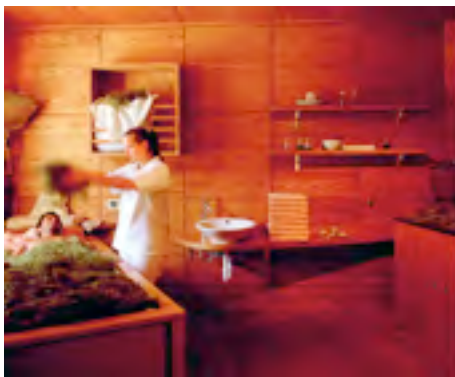
Das wohltuende Heubad....